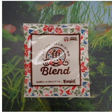
個包装イメージ・表