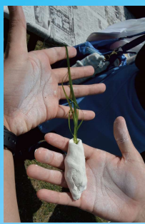
紙粘土をつけたアマモの苗