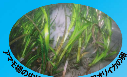
アマモ場の中に産みつけられたアオリイカの卵