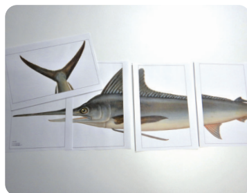
作ってびっくり！メカジキの実物大工作