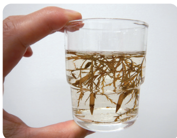
海藻から広がる世界

生活科、理科、社会科、 家庭科を網羅した総合的な 学習内容も可能です！ SDGsの達成に向けた ESDにも役立ちます。