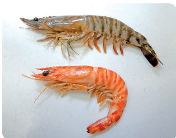
エビの解剖、色の変化

「子どもたちに水産業や魚介類についてもっと知ってもらいたい！」と、過去には小学校に無料でエビやイカ、タイなどをお届けしたりと、日本全国の先生方がすぐに実践できる食育プログラムを紹介・作成しています。