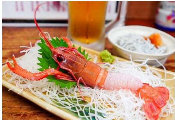
あかざえびの刺身

【解説】漁師歴30年の主人が開業した沼津・伊豆の海の幸をそろえた酒場。名物メニューのあじなめろうを肴に沼津の地酒を飲めば、沼津の夜がきっと楽しくなるはずと訪ねた店は、駿河湾や伊豆半島の魚介類が豊富なだけに、地元の魚喰いが毎夜集まる人気店だった。全国有数の水揚げ量を誇る沼津漁港を中心として、港と東海道を栄えた街、沼津は、最深部で2500メートルに達する日本一深い駿河湾に面した漁業拠点であり、近海から深海まで多種多様な魚介類が沼津市場に集まるという。カウンター前の冷蔵ケースにはカンパチやマグロ、アジの丸魚などが